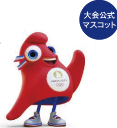
大会公式マスコット

19世紀の有名な絵画「民衆を導く自由の女神」にも描かれ、自由と愛国心を表す「フリジア帽」をモチーフとしたマスコット。人々の生活の中にスポーツをとり込むといった「革命」に導いてほしいという願いが込められています。