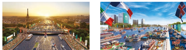
観客の見込みは約60万人。過去最大の開会式になる予定です。

今回の開会式は、史上初めて「競技場の外」で行われます。今大会は多くの競技がパリ市内で実施され「スポーツを町の中に」がテーマの一つに。それを体現するように、パリの中心部を流れる「セヌ川」が開会式の舞台。合計1万人を超える選手たちが国ごとの船に乗ってパレードします。